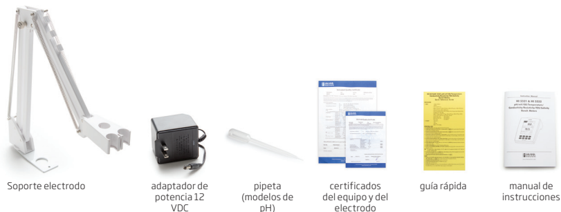
Soporte electrodo adaptador de potencia 12 VDC pipeta (modelos de pH) certificados del equipo y del electrodo guía rápida manual de instrucciones