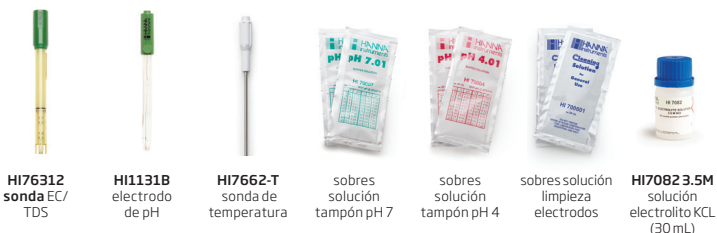
HI76312 sonda EC/TDS HI1131B electrodo de pH HI7662-T sonda de temperatura sobres solución tampón pH 7 sobres solución tampón pH 4 sobres solución limpieza electrodos HI7082 3.5M solución electrolito KCL (30 mL)

HI5521-02 (230V) y HI5522-02 (230V) incluyen: