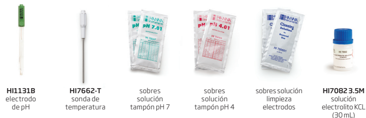
HI1131B electrodo de pH HI7662-T sonda de temperatura sobres solución tampón pH 7 sobres solución tampón pH 4 sobres solución limpieza electrodos HI7082 3.5M solución electrolito KCL (30 mL)

HI5221-02 (230V) y HI5222-02 (230V) incluyen: