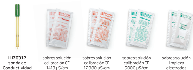
HI76312 sonda de Conductividad sobres solución calibración CE 1413 µS/cm sobres solución calibración CE 12880 µS/cm sobres solución calibración CE 5000 µS/cm sobres solución limpieza electrodos