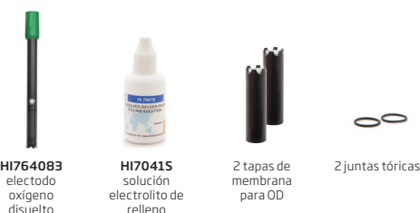
HI764083 electrodo oxígeno disuelto HI70415 solución electrolito de relleno 2 tapas de membrana para OD 2 juntas tóricas